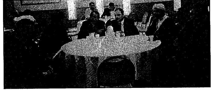
الطاولة الرئيسية في المهرجان